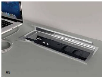
MODULO TRASMISSIONE DATI. Presa RJ45 cat. 6 per la trasmissione dei dati. MODULE FOR DATA TRANSMISSION. Socket RJ45 cat. 6 for the transmission of data. MODULE DE TRANSMISSION DE DONNÉES. Presa RJ45 cat. 6 pour la transmission de données.