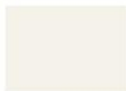
001 Flusso Opaco

► Laccati Opaco Basic dull colours Couleurs opaques de base