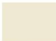
002 Veniglia Opaco