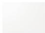
Bianco Opaco Lucido

► Vetri lucidi Polished glass Vetro poli