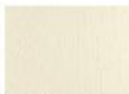
E08 Flusso Spaccato Veniglia