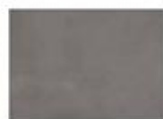
T02 Grigio Pire

► Vetri satinati Frosted glass Vetro satiné