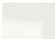
L01 Flusso Lucido

► Laccati Lucido Glossy colours Couleurs brillants