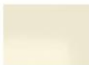
L02 Veniglia Lucido