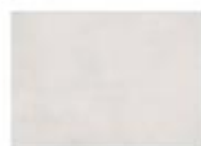
T01 Bianco Silice