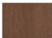
E11 Flusso Tobacco

► Essenze laccate Lacquered wood finishing Finitions bois laqué