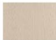
E09 Flusso Spaccato Korda