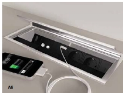
MODULO RICARICA USB. Presa USB DV per la ricarica dei cellulari. MODULE USB CHARGING. DV USB socket for charging mobile phones. MODULE USB CHARGE. DV prise USB pour recharger les téléphones mobiles.